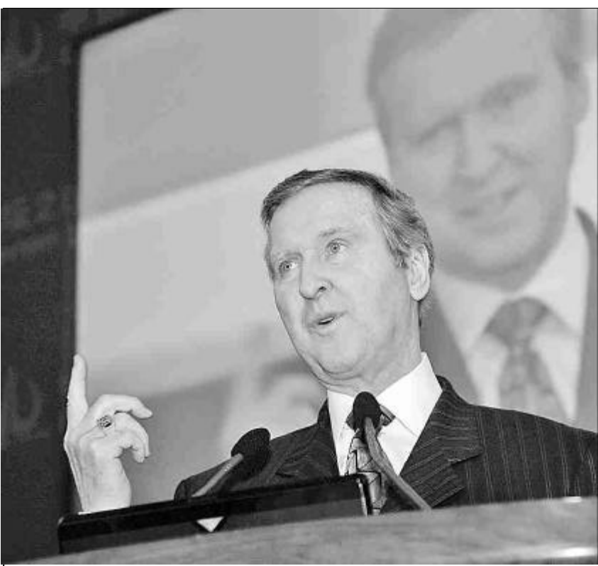
美国前国防部长、全球商业咨询公司科恩集团董事长威廉·科恩，出席在北京举行的中国发展高层论坛2009“国际金融动荡中的中国发展和改革”学术峰会。(资料图片)

科恩：一定要更加透明。现在，这个问题已经是头等大事了。我们必须更清楚地了解中国在扩张军备方面做了哪些事情，中国军队的目标和追求是什么，中国军队是否会加入国际安全体制，中国是否会对本地区其他国家构成威胁。所以这是一个重要问题——更加透明、更加开放、更多的军事交流。这样就能减少误判的风险。这些事情要一步步来，也是很有必要的，因为只有这样，我们才不会认为中国军队变得更加强大、更加具有侵略性。如若不然，美国或者其他国家会产生对抗反应，为了保卫自己或者阻吓中国军队越来越强大的地位而加强自身